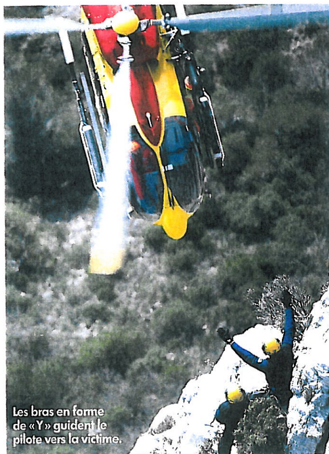
Les bras en forme de « Y » guident le pilote vers la victime.

Lors de l'alerte, la zone d'atterrissage doit avoir été évaluée de même que les conditions météo. À l'arrivée sur zone, l'hélico peut avoir des problèmes de repérage en cas d'environnement « complexe » (forêt, canyon, gorge, etc.) nécessitant pour